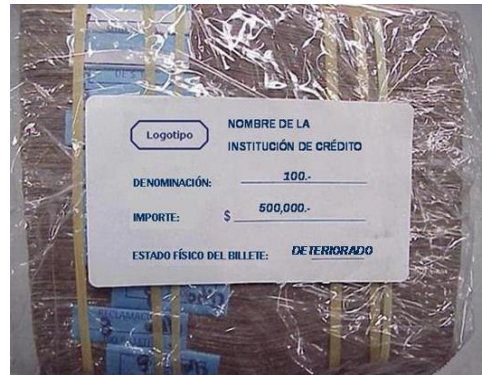
Ejemplo de Etiqueta de Identificación