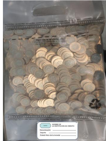
Ejemplo de Etiqueta de Identificación