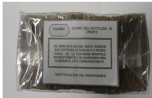
Ejemplo de etiqueta de mazo